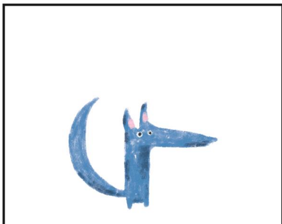
LUPUL CEL MIC