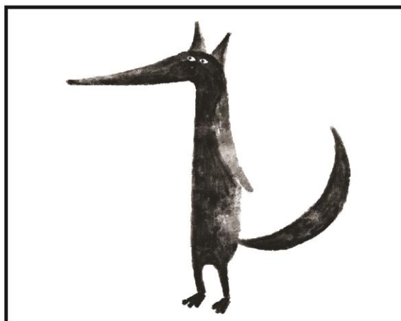
LUPUL CEL MARE